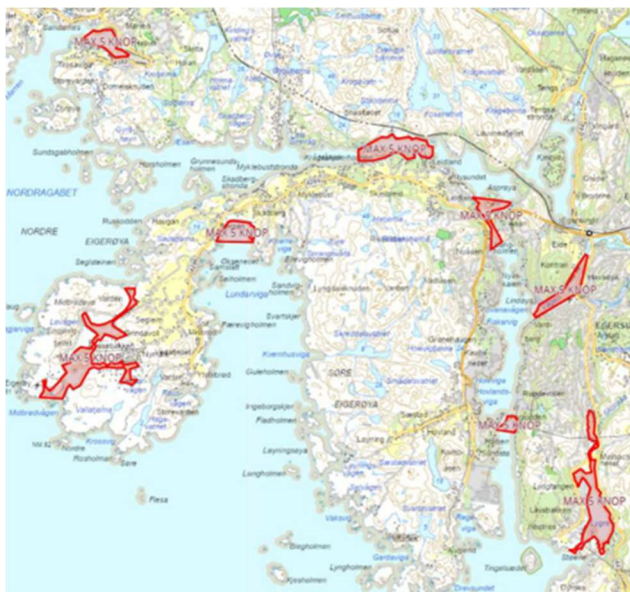
Figur 4: Viser områder hvor det vil gjelde 5 knop for fritidsfartøy i Eigersund kommune.

Eigersund. I tillegg har kommunen etablert en generell fartsgrense på 5 knop 50 meter fra land hele året.