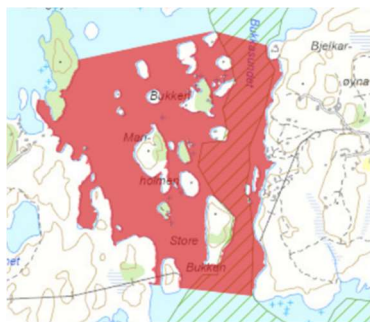
Figur 1: Røde skraverte felt: 5 knop for næringsfartøy. Grønne skraverte felt: farledsareal hvor Kystverket har ansvar for fartsregulering av fritidsfartøy.

I høringsforslag fra 4. januar 2024 har Bergen Havn Farvannsforvaltning IKS foreslått å regulere farten for fritidsfartøy i kommunens sjøområde i Bukkasundet med en fartsgrense på 5 knop. Kystverket ønsker derfor å revidere den statlige forskriften slik at fartsgrensen i leden gjennom Bukkasundet blir 5 knop også for fritidsfartøy.