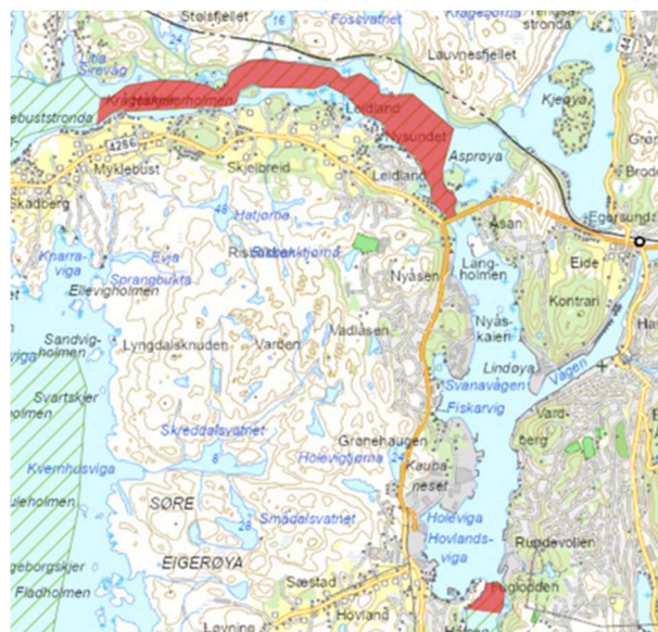
Figur 3: Røde skraverte felt: 5 knop for fritidsfartøy.

Bakgrunnen for at Kystverket vedtok disse fartsgrensene, var forutsetningen om at Eigersund kommune ville gi tilsvarende bestemmelser i kommunens fartsforskrift for fritidsfartøy i kommunens sjøområde.